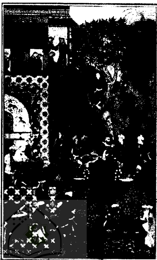
ت ۲. (راست) نامعلوم، تفریح (سده دهم هجری)، مرقع گلشن، کاخ گلستان، تهران، ماخذ: شاهکارهای نگارگری ایران، ص ۴۶۵